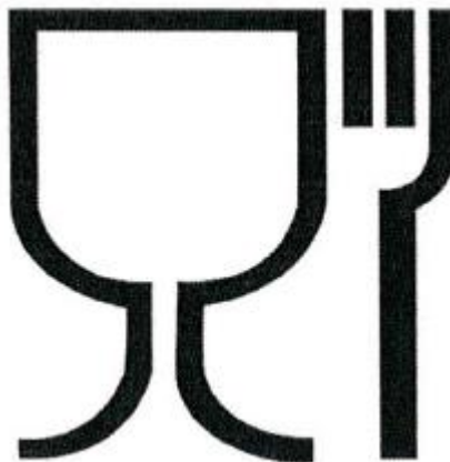
Рис.1. Упаковка (укупорочные средства), предназначенная для контакта с пищевой продукцией Символ, обозначающий, что упаковка предназначена для контакта с пищевой продукцией, допускается наносить как без рамки, так и в рамке (круглой, квадратной и др.).